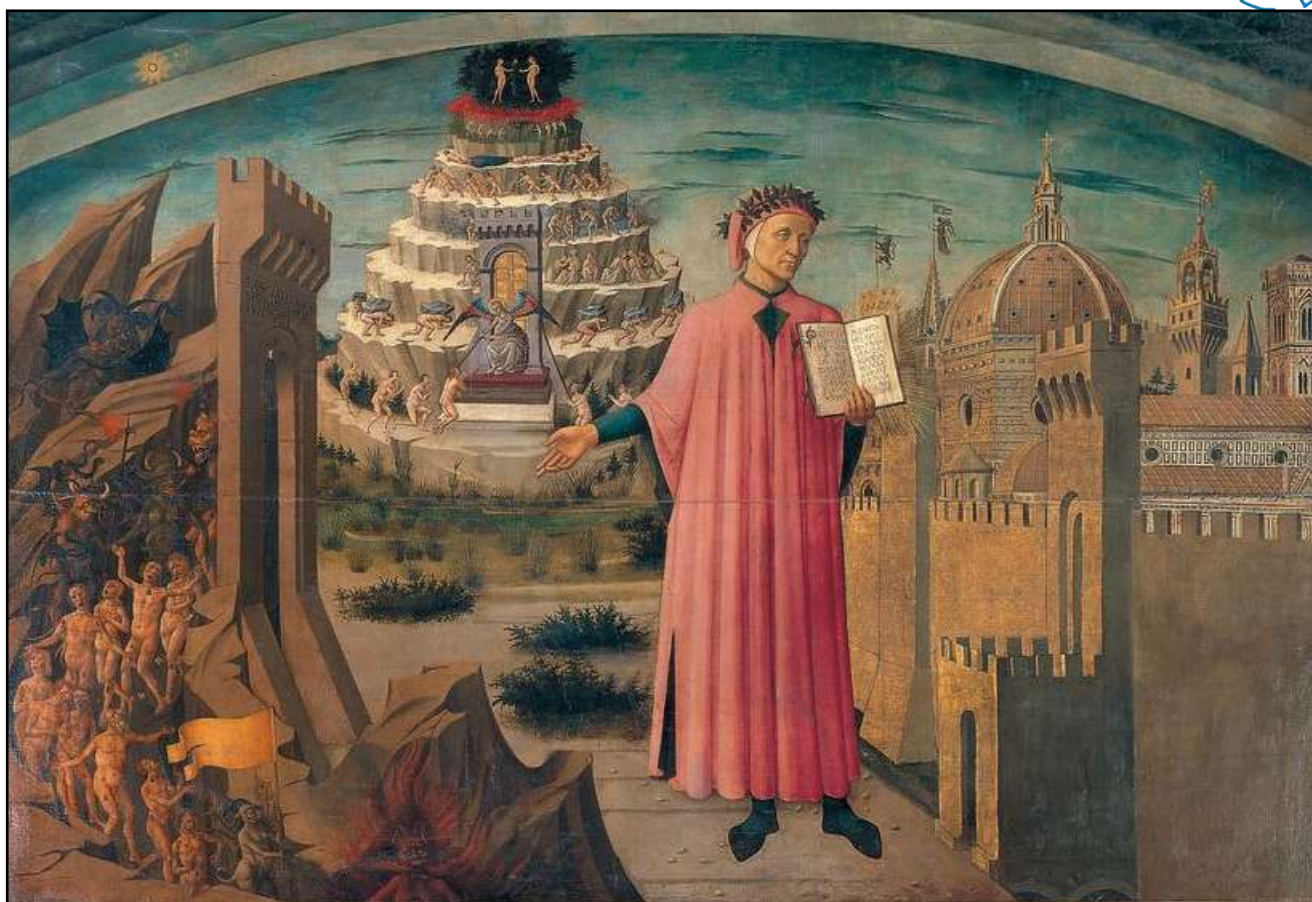
Dante e il suo poema (affresco di Domenico di Michelino)