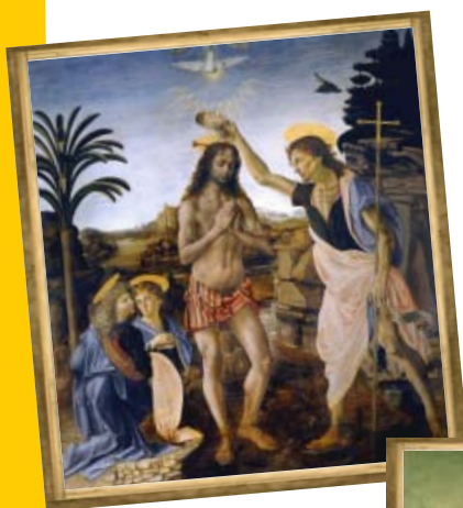
Battesimo di Cristo.

All'inizio si occupava di realizzare piccole parti di grandi dipinti. Ad esempio il "Battesimo di Cristo" del Verrocchio è alto quasi due metri! Leonardo dipinse l'angelo sulla sinistra: Verrocchio pensò che quell'angelo fosse talmente bello rispetto al resto del quadro che decise di affidare a Leonardo tutti i nuovi dipinti. Nel 1503, Leonardo cominciò a dipingere una signora fiorentina. Il quadro noto come la "Gioconda" , conosciuta anche come "Monna Lisa" si trova, oggi, al Louvre di Parigi. Dieci anni dopo, Leonardo aprì una bottega tutta sua a Firenze. Tra i suoi clienti c'erano anche i Medici, una delle famiglie più importanti e potenti d'Italia.