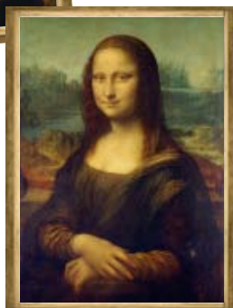
La Gioconda o Monna Lisa.