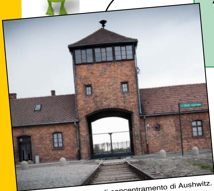
L'entrata del campo di concentramento di Aushwitz.

E' stata scelta questa data perché nel 1945 proprio il 27 gennaio l'esercito sovietico (i Russi) entrava nel campo di concentramento di Auschwitz , in Polonia, ponendo fine alla persecuzione del popolo ebraico. I sopravvissuti testimoniarono su quello che era successo. I campi di concentramento erano dei luoghi circondati da filo spinato dove venivano chiusi e fatti lavorare duramente i prigionieri.