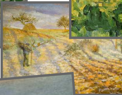
Camille Pissaro ►