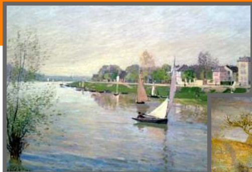
Alfred Sisley ▲

Ogni pittore dipinge con il proprio stile personale, ma a volte è possibile riunire più pittori sotto la stessa corrente artistica (gruppo di persone con lo stesso stile di pittura).