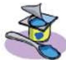
Formaggio alla frutta