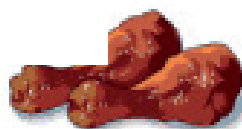
Cosce di pollo