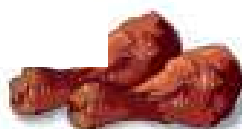
Cosce di pollo